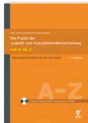
Die Praxis der Jugend- und Auszubildendenvertretung von A bis Z Rudolf/Ratayczak/Ressel/Lenz/Meyer

Rieder Verlag 2. Auflage 2011 Seitenzahl: 122 Ausgabe: kartoniert ISBN: 978-3-939018-62-9 Preis: 18,50 Euro