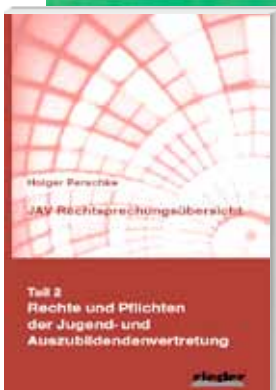
JAV Rechtsprechungsübersicht – Teil 2 – Rechte und Pflichten der Jugend- und Auszubildendenvertretung Perschke, Holger

Bund-Verlag 2. Auflage 2011 Seitenzahl: 185 Ausgabe: kartoniert ISBN: 978-3-7663-6112-7 Preis: 12,90 Euro