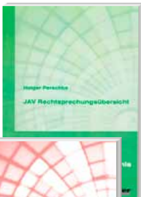
JAV Rechtsprechungsübersicht – Teil 1 – Rechte und Pflichten im Berufsausbildungsverhältnis Perschke, Holger

Bund-Verlag 6. Auflage 2011 Seitenzahl: 512 Ausgabe: gebunden ISBN: 978-3-7663-6007-6 Preis: 49,00 Euro