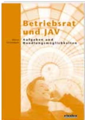
Betriebsrat und JAV – Aufgaben und Handlungsmöglichkeiten Schwarzbach, Marcus

Rieder Verlag 2. Auflage 2011 Seitenzahl: 122 Ausgabe: kartoniert ISBN: 978-3-939018-62-9 Preis: 18,50 Euro