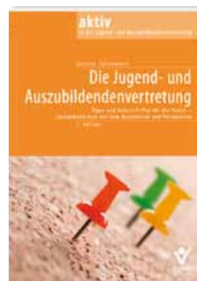
Die Jugend- und Auszubildendenvertretung / Tipps und Arbeitshilfen für die Praxis Splanemann, Andreas

Rieder Verlag 1. Auflage Oktober 2010 Seitenzahl: 132 Ausgabe: kartoniert ISBN: 978-3-939018-33-9 Preis: 24,00 Euro