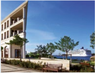
1 Kongresszentrum (Meerseite)