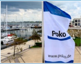
Yachthafenresidenz Hohe Düne