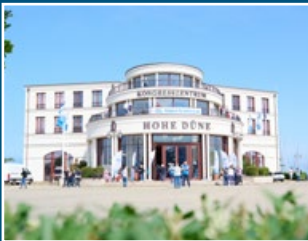
1 Kongresszentrum (Landseite)